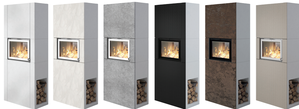
Weiß gestrichen Dekorfront Marmor Carrara Dekorfront Marmor Ruivina sandgestraht Dekorfront Diamond Black Dekorfront Rusty Brown Dekorfront Diamond Silver

Eine einfarbige, glatte Oberfläche ist ebenso möglich wie edler, weißer Marmor oder eine dekorative Front aus Keramik. Der Blickfang ist das lodernde Feuer, eingebettet in eine Oberfläche aus hochwertigen, modernen Materialien.