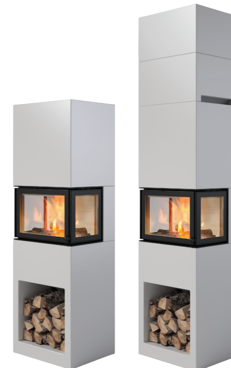
Praha Praha mit Verlängerungsset

Die angenehme Wärme, die sich in Ihrem Heim ausbreitet, heißt Konvektionswärme und entsteht zwischen Heizeinsatz und Verkleidung. Kalte Luft wird im Bodenbereich angesaugt und durch den Heizeinsatz aufgeheizt. Die Luft steigt nach oben und tritt über dem Konvektionsluftaustrittsgitter in den Raum aus. Lesen Sie mehr über unsere Kamine auf www.nordpeis.de